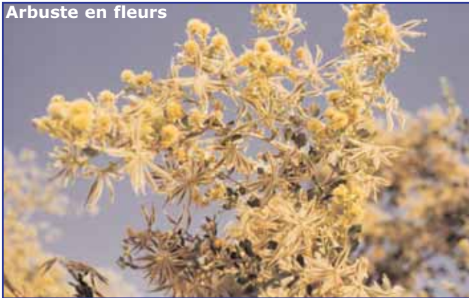
Arbuste en fleurs

Les oasis ont donné le palmier-dattier, l'un des piliers de l'économie, et il faut citer le palmier-doum, dont les fibres servent à la fabrication des habitations.