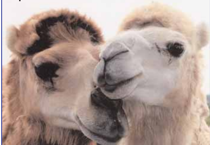
Couple de dromadaires

On a souvent porté des jugements moraux sur le nomadisme assimilant celui qui le pratique à un brigand ou à un pillard sans foi ni loi. Il a fallu du temps pour comprendre que le nomadisme n'est pas une errance hasardeuse, mais une organisation précise, écologique et/ou politique.